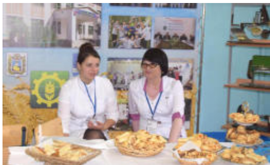
На выставке достижений колледжа