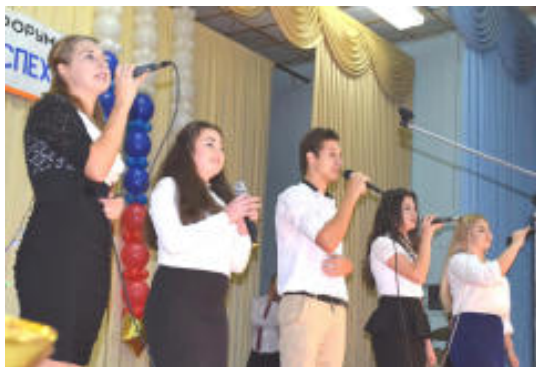
Выступление вокальной группы колледжа