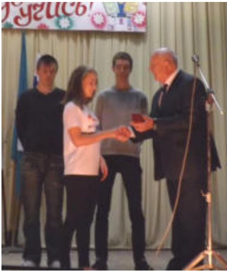
Вручение студенческих билетов Выступают первокурсники

1 сентября мы вошли в стены Светлогорского регионального сельскохозяйственного колледжа. Впереди – годы учебы, освоения специальности. Теперь мы не ученики, а студенты. И 28 сентября состоялось торжественное мероприятие – посвящение первокурсников в студенты.